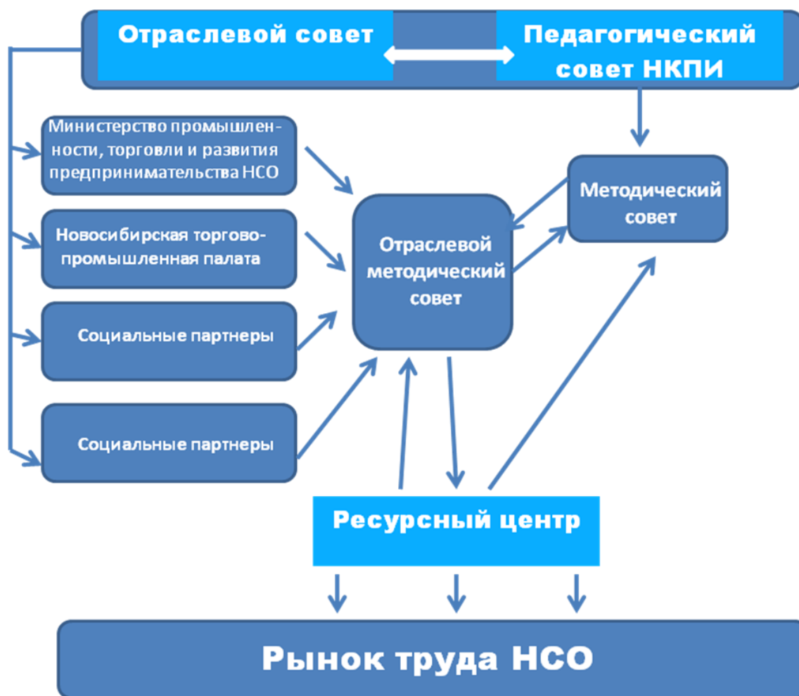
Рис. 2 Схема взаимодействия Новосибирского колледжа парикмахерского искусства с социальными партнерами

собрания, на заседаниях методических комиссий, в работе первичной профсоюзной организации. Тесные контакты с работодателями и социальными партнерами, их участие в образовательном процессе и заинтересованность в высоких результатах выпускников также способствуют включению представителей реального производства в планирование и осуществление Программы развития колледжа. Для достижения качества подготовки студентов в рамках Программы развития с участием работодателей разрабатывается и совершенствуется методическое сопровождение – программы подготовки квалифицированных рабочих, служащих и специалистов ФГОС СПО, дополнительные профессиональные программы подготовки, переподготовки и повышения квалификации работающего населения, а также система контроля качества обучения. Методическое сопровождение включает учебные планы, рабочие программы учебных