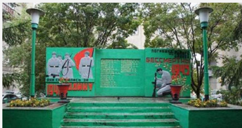
Памятник «Они сражались за Родину»