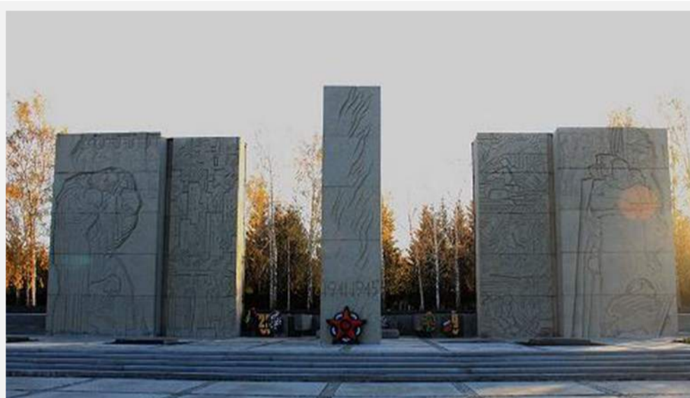
Монумент Славы в честь подвига сибиряков в годы Великой Отечественной войны