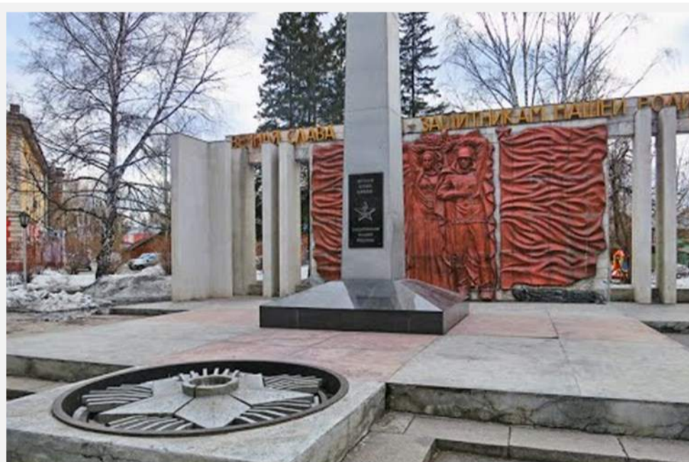
Монумент Славы, посвященный перомайцам, погибшим в 1941-1945 гг.